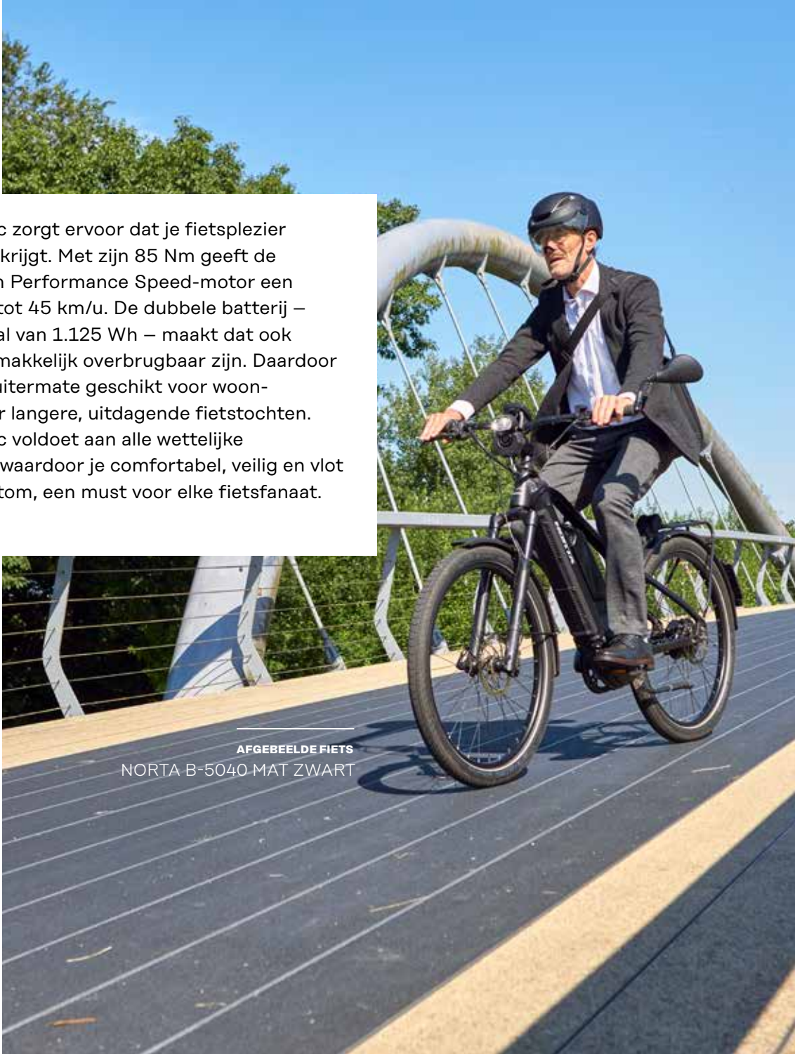
AFGEBEELDE FIETS NORTA B-5040 MAT ZWART