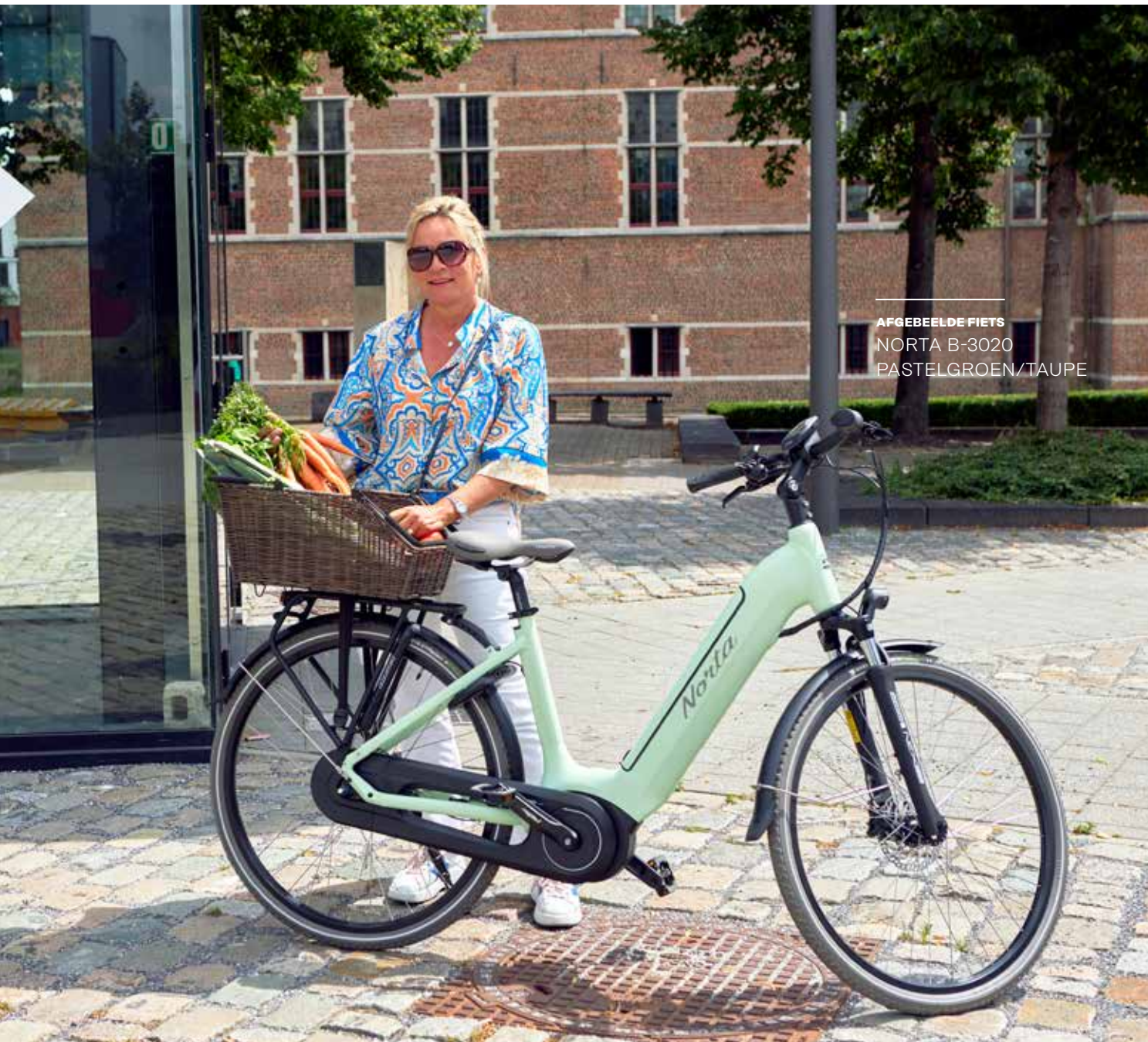
AFGEBEELDE FIETS NORTA B-3020 PASTELGROEN/TAUPE