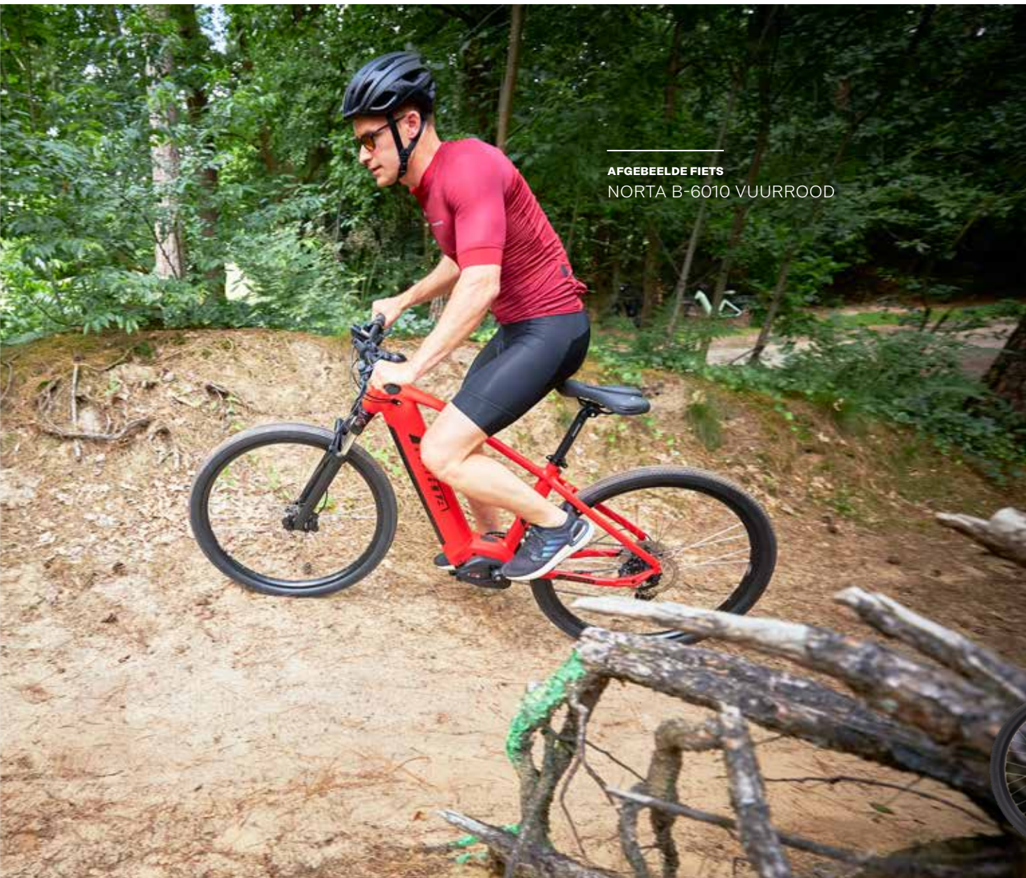
AFGEBEELDE FIETS NORTA B-6010 VUURROOD