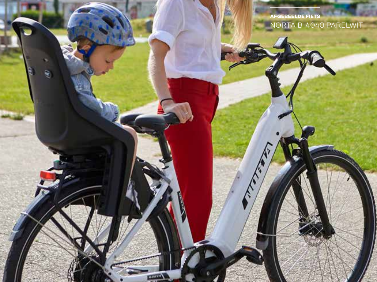
AFGEBEELENDE FIETS NORTA B-4040 PARELWIT