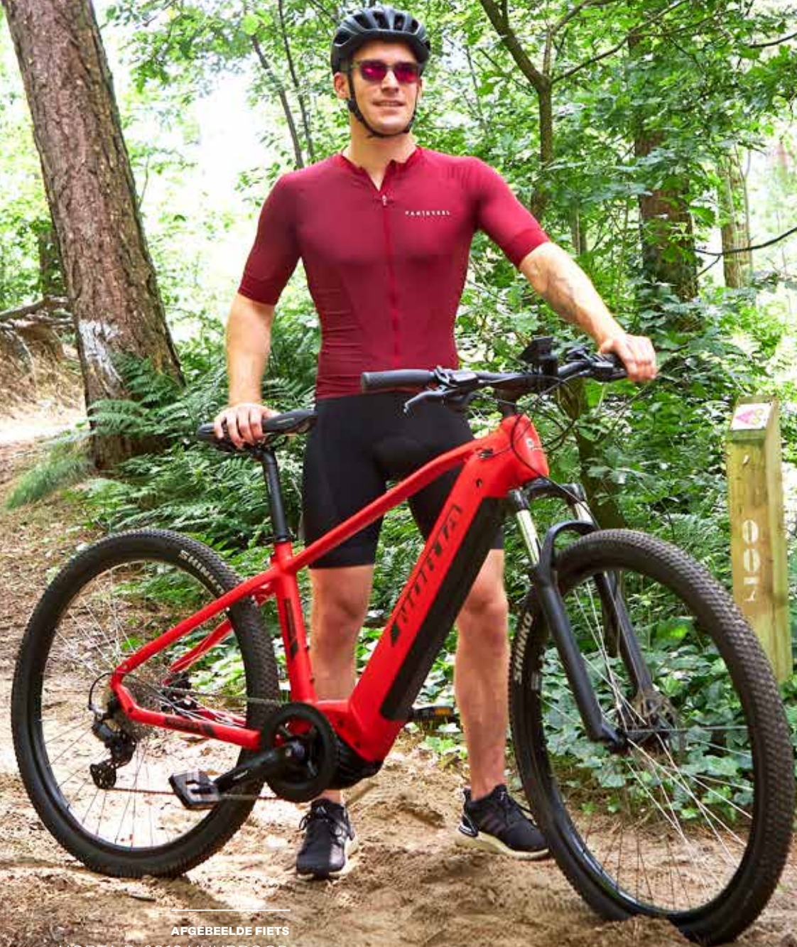
AFGEBEELDE FIETS NORTA B-6010 VUURROOD

Met de B-6000 serie ben je perfect uitgerust voor om het even welke fietstocht. Of je nu kiest voor stevige actie in het bos of een lange rit door de natuur: met de krachtigste Bosch Performance Line CX-motor trotseer je moeiteloos elke beklimming. De in het frame geïntegreerde batterij van 750 Wh zorgt ervoor dat je ook bij langere tochten kan genieten van voldoende ondersteuning. Met de verende voorvork van magnesium en de stevige off-roadbanden blijf je comfortabel fietsen. En via het smart system van Bosch blijft je e-bike steeds up-to-date met de allerlaatste functies.