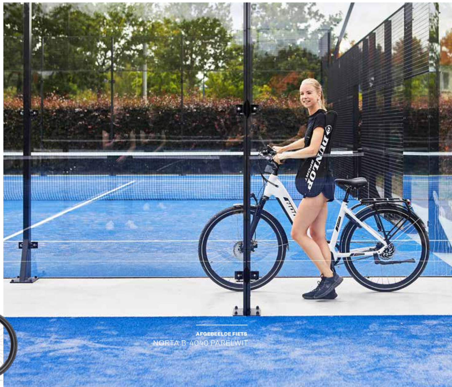
AFGEBEELDE FIETS NORTA B-4040 PARELWIT